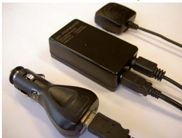
GPS Fahrzeugtranceiver GMT Lieferumfang: GPS-Empfänger, Antenne, Anschlusskabel und Zigarettenanzünderstecker 12-24V

Absicherung von Service- und Wartungspersonal mit Einsatz an wechselnden Standorten durch BG konforme GSM Personen-Notsignalanlage mit dem felsenmeer GSM-S plus.