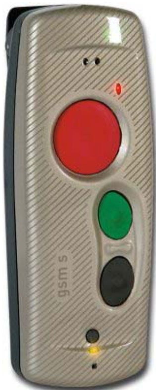
Personen-Personensicherungsgerät GSM-S plus Maßstab 1:1

Lieferumfang: GSM-Gerät - Li-Ion Akku - Clip Tischladegerät 230VAC