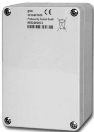
Ortungssender GSO-V oder GSO-VA

Lieferumfang: GSM-Gerät - Li-Ion Akku - Clip Tischladegerät 230VAC